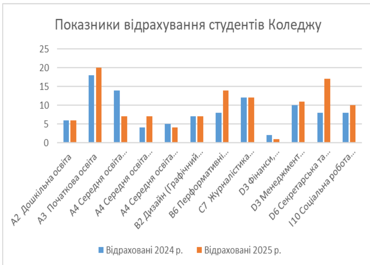
Рис. 4.1. Показники відрахування студентів Коледжу

За звітний період 9 студентів оформили академічну відпустку; 2 студенти переведено до іншого закладу освіти. За 2025 рік до Коледжу поновилося після відрахування 2 студенти.